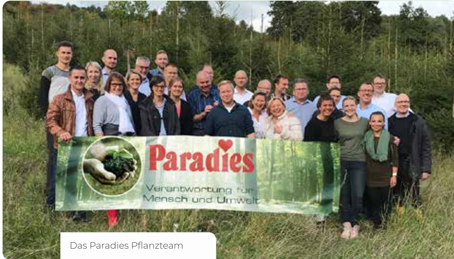
Das Paradies Pflanzteam

Engagement für die Umwelt und die Kleinsten. Wir müssen uns um diejenigen kümmern, die nicht selbst für sich sorgen können.