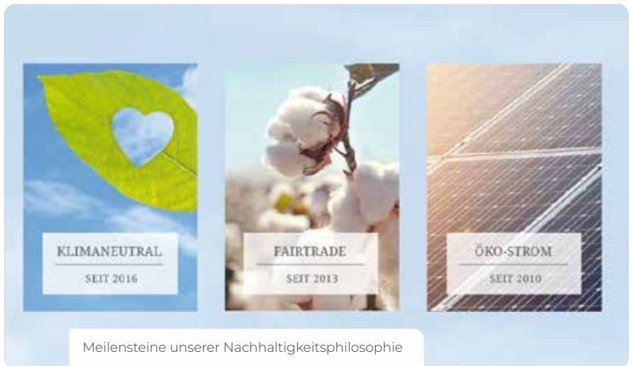
Meilensteine unserer Nachhaltigkeitsphilosophie

Modernisierung der Heizungsanlage bzgl. Energieeffizienz, Vermeidung von Wärmeverlust in Leitungssystemen.